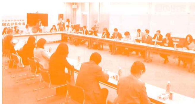
出席支部長全員が1人3分間のスピーチを行い、各支部の状況報告・苦勞話・地域の話などを聞くことができた。