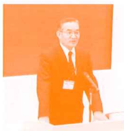
原山事務局長挨拶